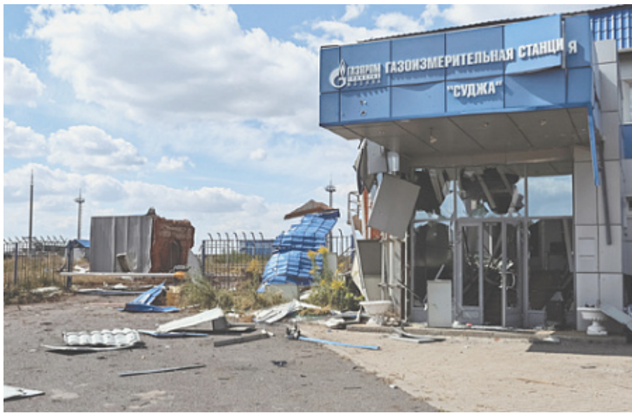
В настоящее время поступление российского газа в Европу по украинскому маршруту возможно только через перекачивающую станцию в курской Судже.

осуществлять транзит нефти в ЕС до даты завершения контрактных обязательств, то есть до конца 2029 года, опровергнув таким образом свое предыдущее заявление о том, что Украина прекратит транзит российской нефти по трубопроводу «Дружба» с 1 января 2025 года.