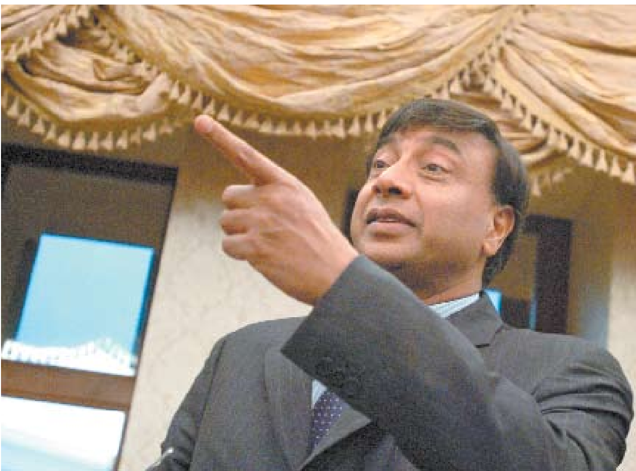
Лакшми Миттал задумал обернуть дело вокруг пальца

По данным «i», в 2008 г. на «АрселорМиттал Кривой Рог» ожидаются трудности со следующими пунктами выполнения инвестпрограммы: модернизация кислородной станции, высоковольтного электроснабжения, секций обогатительных фабрик №8 и №12. Собственник крупнейшего в стране метпредприятия до конца года должен был вложить по утвержденному плану-графику